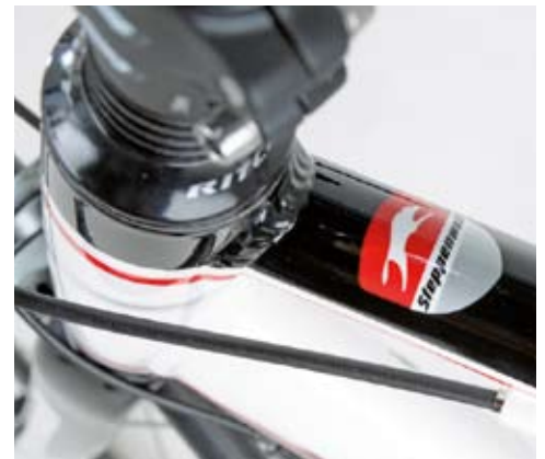
Sauber: unverschliffene gleichmäßige Schweißnähte.

Die Zuganschlüsse sitzen am Unterrohr, die Züge können daher auf dem ungeschützten Steuerrohr kratzen. Die Laufräder sind sorgsam verarbeitet,