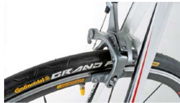
Sicher: Bremsen und Felgen harmonieren.

Neopren-Protector auf der Kettenstrebte wirkt wie Mountainbike-Zubehör, ist aber auch am Rennrad kein Fehler.